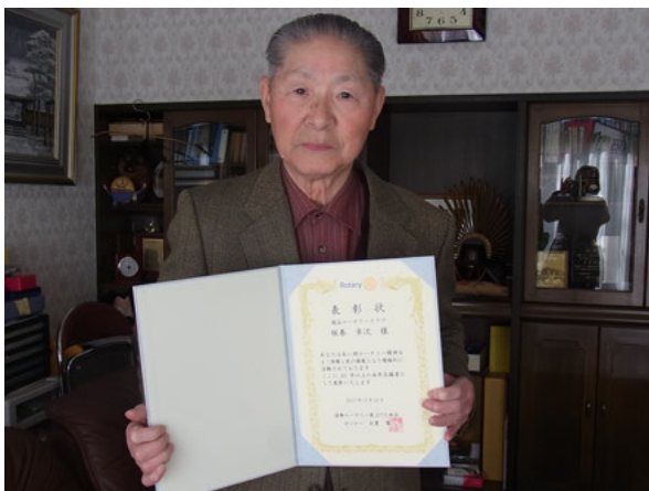
2017-'18年度 永年在籍表彰 46年