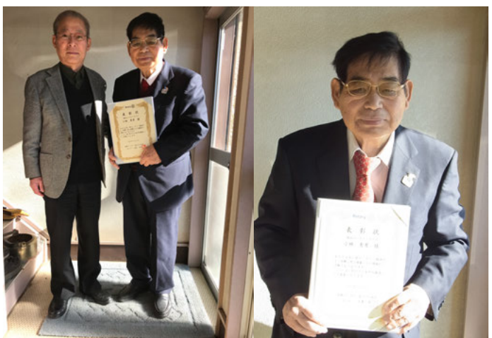
2016-'17年度 永年在籍表彰 45年 2017-'18年度 永年在籍表彰 46年