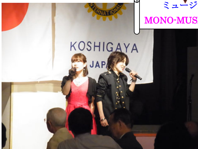
ミュージカルグループ MONO-MUSICA (モノムジカ) 様