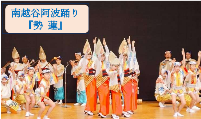
南越谷阿波踊り 『勢蓮』